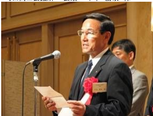
写真右 左より 町田商工会議所 むさし府中商工会議所中小企業相談所 武蔵野商工会議所中小企業相談所 立川商工会議所 八王子商工会議所 青梅商工会議所