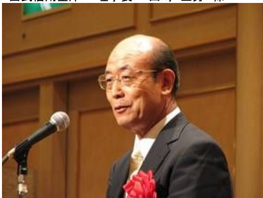
写真右 左より 中小企業診断協会東京支部 城西支会 (社)首都圏産業活性化協会(TAMA協会) 西武信用金庫